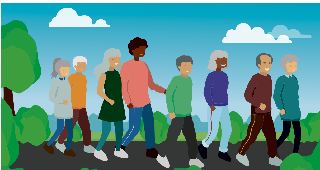
Die neue Senioren- und Seniorinnengruppe «Zämmä Laufe»

Zusammen mit dem Seniorenrat initiiert die Koordinationsstelle für das Alter eine «Zämmä-Laufe-Gruppe» für Seniorinnen und Senioren, welche ab Mai wöchentlich eine gemeinsame Runde geht. Immer am Donnerstagvormittag trifft sich die Gruppe zum gemeinsamen Laufen. Die Weg-