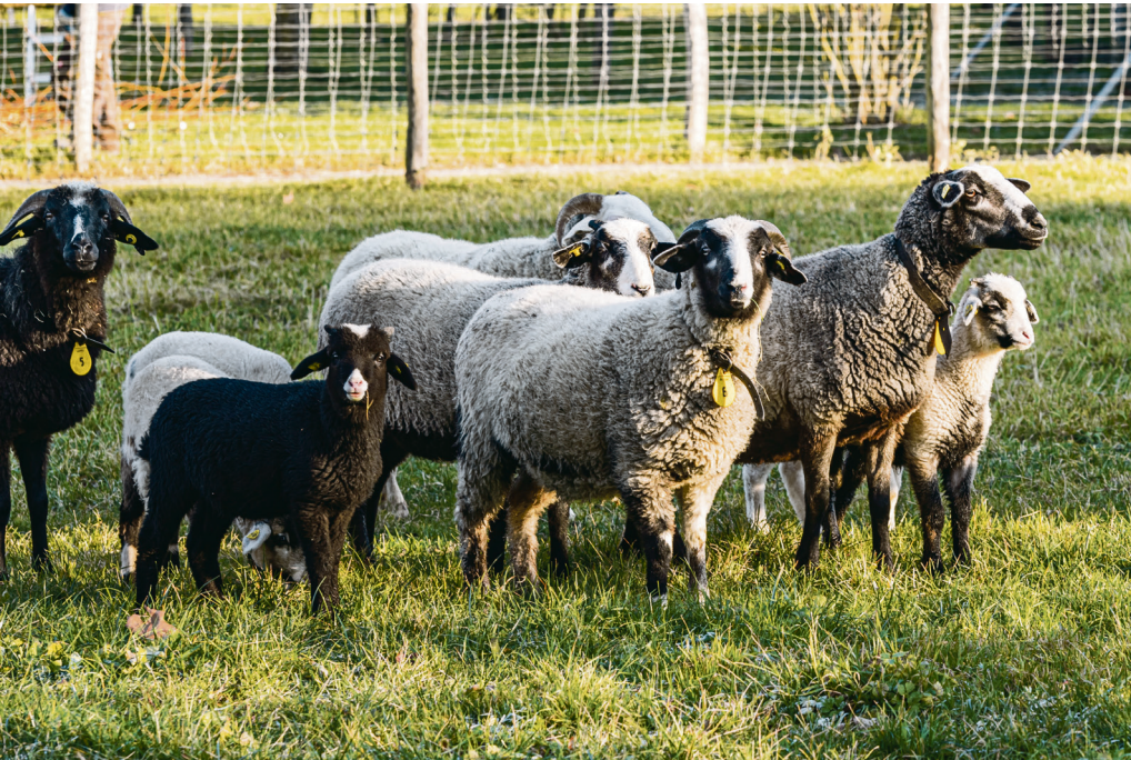
Diese Bündner Oberländer Schafe züchten die Merian Gärten für ProSpecieRara.

noch ihren Hauptsitz (heute auf Schloss Wildegg). Die Partnerschaft mit den Merian Gärten bleibe jedoch wichtig, so die Stiftung. Einerseits als Beitrag zum Erhalt alter Tierrassen und Pflanzensorten, andererseits, um den Kontakt mit einer städtischen Bevölkerung sicherzustellen.