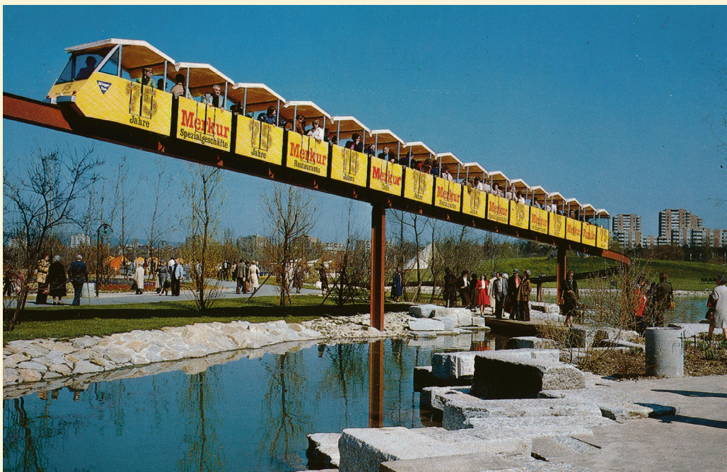
Hat Spass gemacht: im Monorail über die Grün 80 zu gleiten