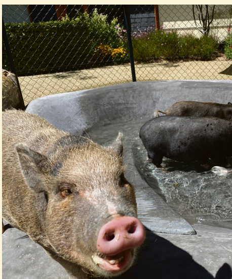
Freut sich immer über Besuch: unser Oscar