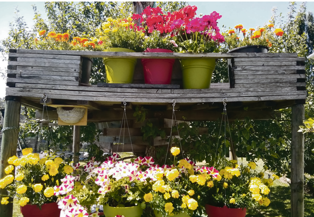
Mein ganzer Stolz – hängende Gärten im Pfarrgarten

Eine zweite biblische Garten-Geschichte will ich erwähnen, die einen ganz anderen Ton setzt. Nachdem Jesus durch Galiläa