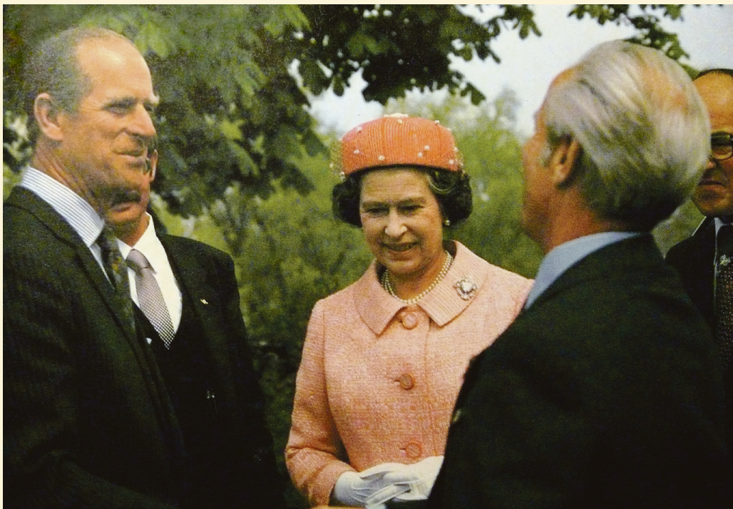
Die Queen besuchte Münchenstein und pflanzte symbolisch ein Bäumchen