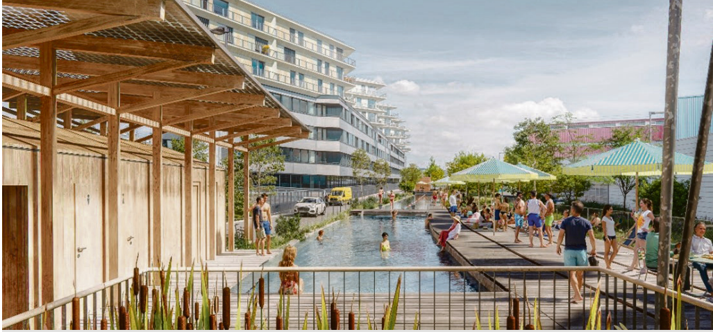
Schöne Aussichten im Dreispitz! Visualisierung des Naturbads auf den Gleisanlagen Bild: Malheur&Fortuna