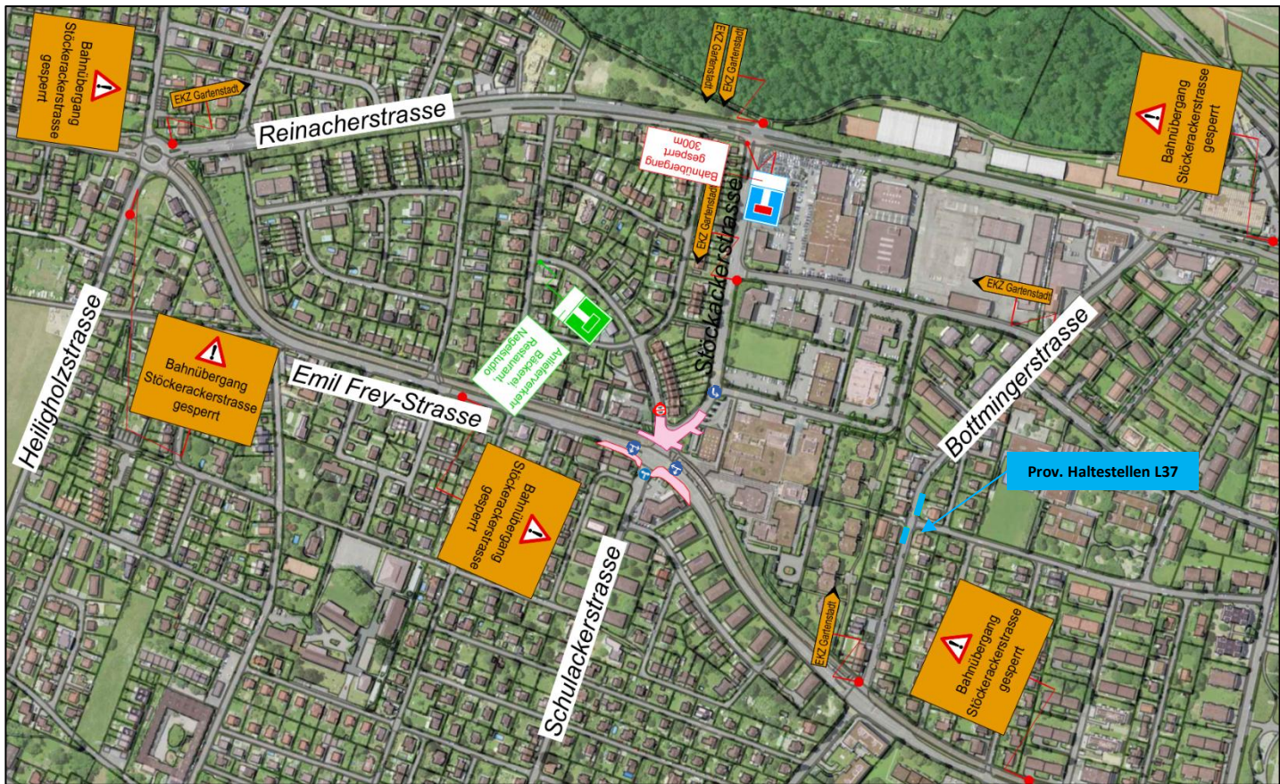
Skizze 1: Bauphase „Vorarbeiten“ Tramvollsperrung